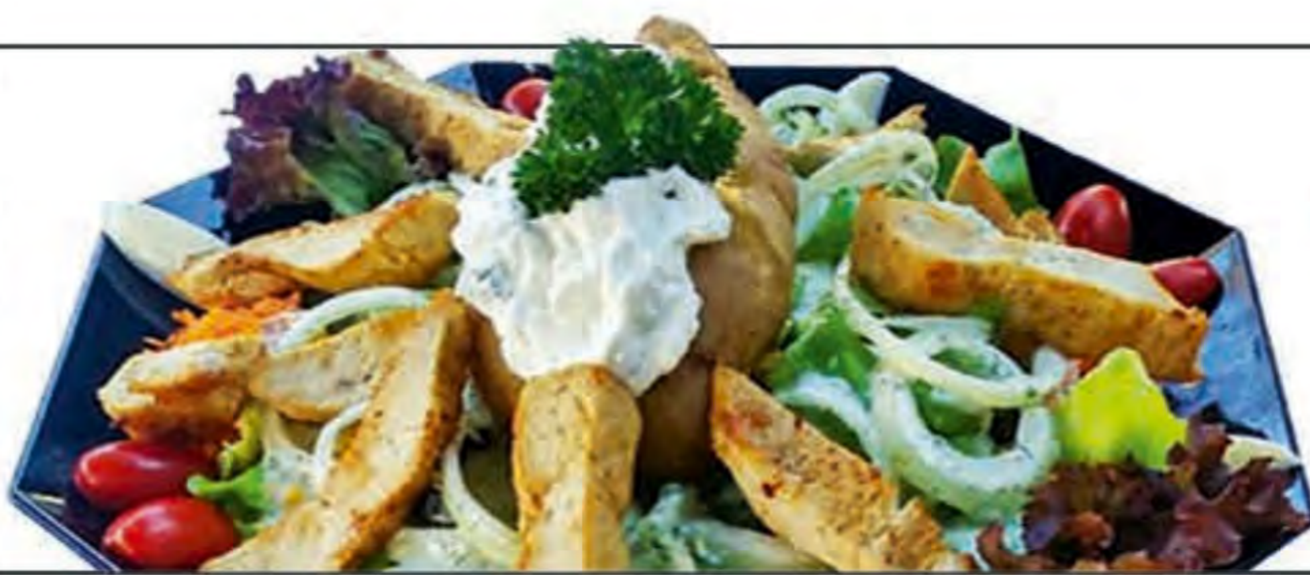
King Size Salat